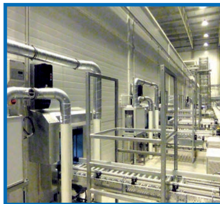
Помещение для хранения инертного газа