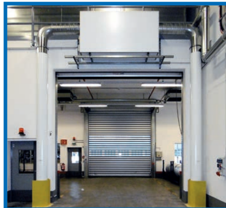
Промышленные ворота: защита от летучих насекомых

Воздушные потоки, выдуваемые под большим давлением навстречу друг другу из вертикальных воздуховодов arwus, расположенных слева и справа от проёма, создают сплошное воздушное полотно в плоскости проёма, которое препятствует движению воздуха в проёме и как следствие - от смешивания различных газов.