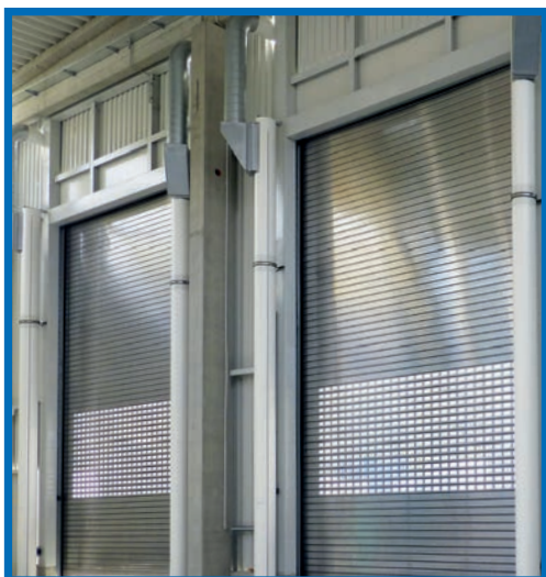
Защита от неприятных запахов, установка для сортировки и очистки отходов